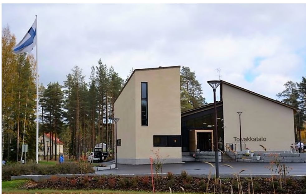
Toivakkatalo - Toivakan kunnan kuvamateriaalia