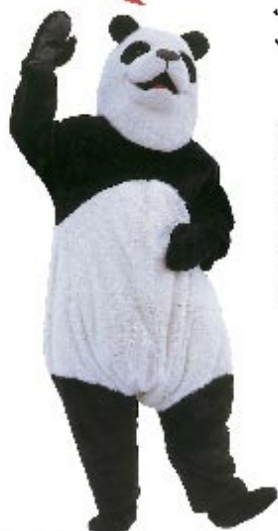
Järjestää: Toivakan yrittäjät ja Toivakan kunta

Kirjasto auki lauantaina klo 10-14 * Satutuokioita tasaturnein, tenavaparssi * Toivakan lasten harrastotoiminnan ja taiteen esittely * Kirjojen vaihtori